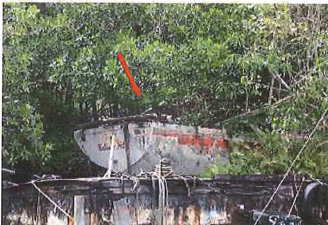
navire n° 33

Type de navire : voilier monocoque Immatriculation : inconnu Nom de navire : Rendez-vous Longueur : entre 8 et 12 mètres Couleur : blanche Matériaux : polyester Localisation : mangrove, au Morne Cabri, commune du Lamentin Autre : état dégradé